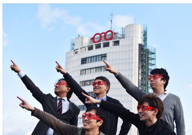
「めがねフェスめがね」販売中!