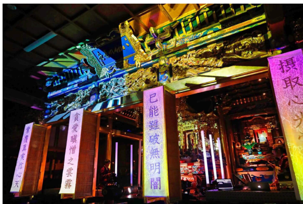
めがねテクノ法要