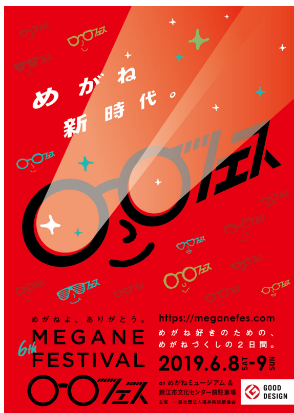
めがねフェス 2019 ビジュアルイメージ