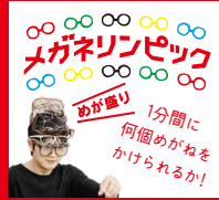
メガネニッピックステージ