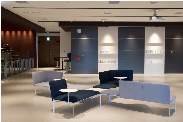
AP 東京丸の内（セミナー会場）エントランス

お申し込み先： http://peatix.com/event/122925 （Peatixよりお申し込みください）