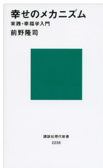
前野隆司教授著書