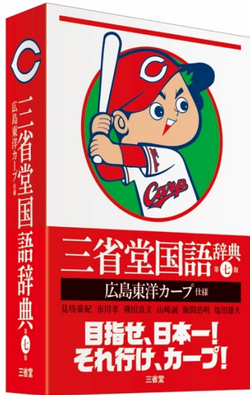
装丁まるごとカープ仕様