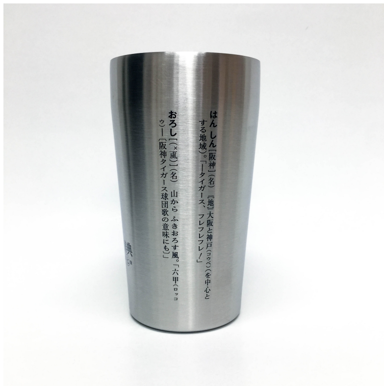
側面にはオリジナル項目をプリント。