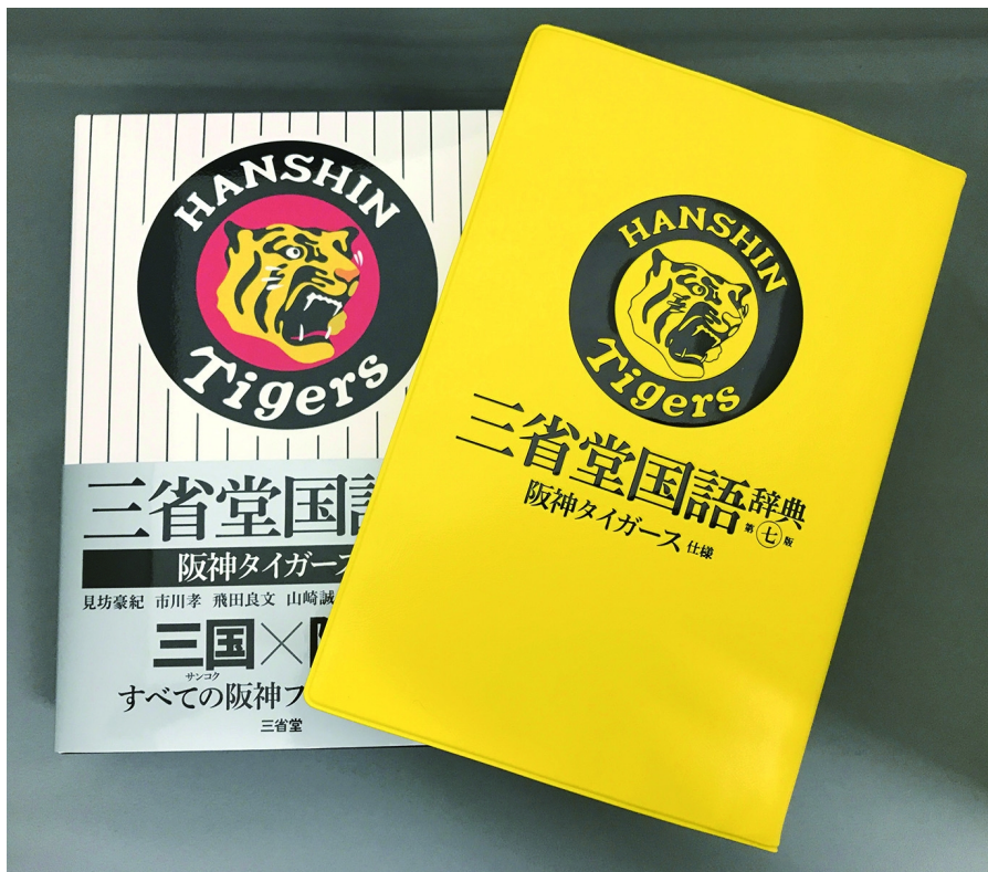
ケースには虎のロゴマーク。表紙はもちろんタイガースイエロー

本書の発売（2018年2月）から6月末日までの期間に、オリジナル図書カードが当たる第一弾キャンペーンを実施しました。キャンペーン期間内には多数のご応募をいただき、読者の皆様の多くから、ハガキを通じてたくさんの熱いメッセージをお寄せいただきました。