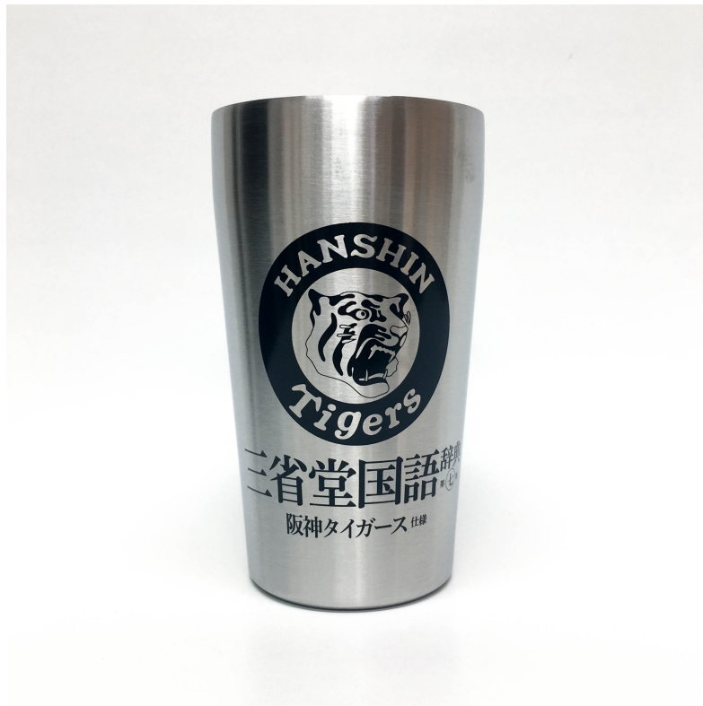
『三省堂国語辞典 第七版 阪神タイガース仕様』特製タンブラー。