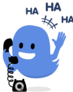
電話でおしゃべりしたい人