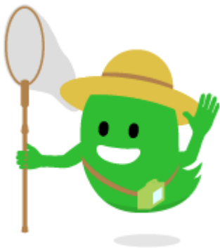
ピュアな心を持っている人