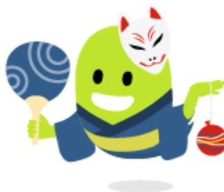
浴衣が似合いそうな人