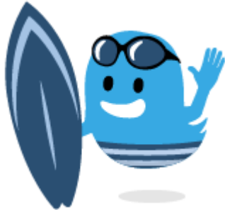
一緒に夏を楽しみたい人