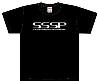
A賞：映画『シン・ウルトラマン』オリジナルTシャツ