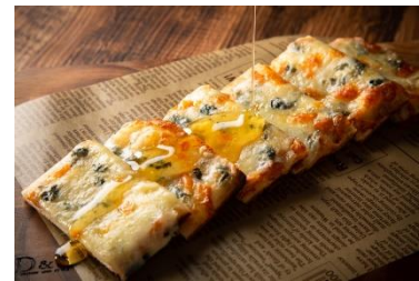
3種チーズとはちみつのピザ 750円