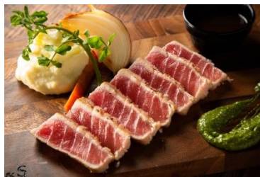
中トロまぐろのレアステーキ ～トリュフ香るガーリックバターソース&山葵クリーム～ 1,290円