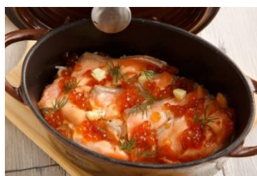
サーモンといくらのココットごはん 1人前(2人前から) 790円