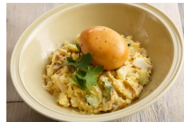
自家製薫製半熟煮玉子と ベーコンのポテトサラダ 590円