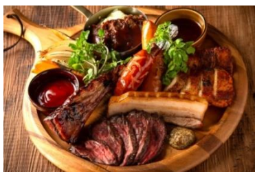
7種盛りミートプレート 3,290円