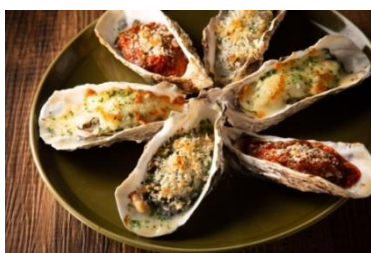
広島産大粒焼き牡蠣3種盛り合わせ 850円～ 単品・追加1P/290円