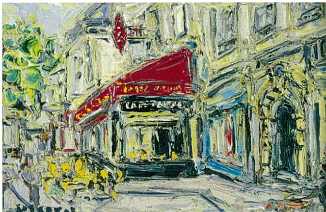
「シャンゼリゼのタバコ屋」2001年 27x41cm