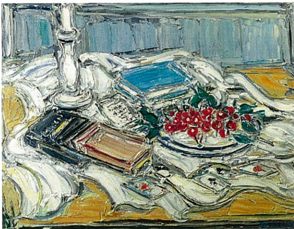
「テーブルの上の静物」1997年 65x81cm