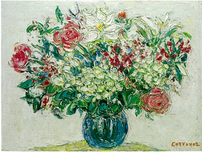
「アジサイのブーケ」2008年 61x81cm