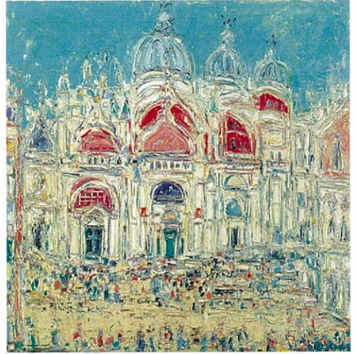
「サンマルコ広場」1994年 100x100cm