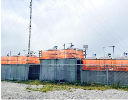
図2 スキャニングライダー ※1 用の架台