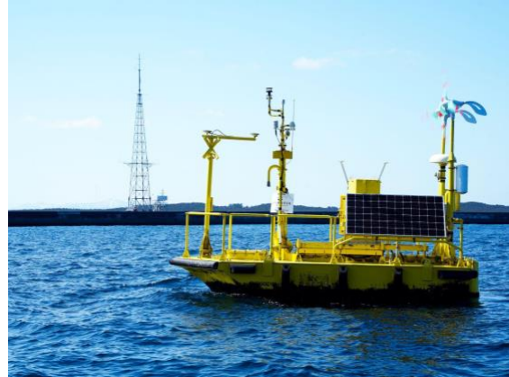
図3 フローティングライダー ※2 による観測の様子