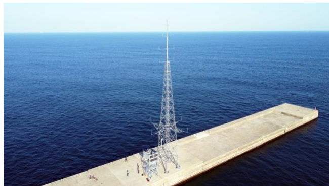
図1 洋上風況観測マスト

今後、風力発電事業の関係者、研究開発プロジェクト（風況、気象、生態系、環境など）の事業者、港湾の安全や教育に関わる地元関係者などに広く利用される試験サイトとして展開することを目指し、風況観測の精度を向上させることで洋上風力発電をはじめとする再生可能エネルギーの導入促進および地域社会の発展に貢献します。