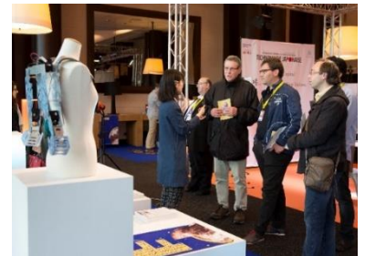
「バン・ニューメリック 2016」出展の様子

ナレッジキャピタルは、2015年9月にCDAとMOU(相互連携に関する覚書)をフランスにて締結し、相互訪問を重ねるなど継続的なリレーションシップを構築しています。このたび、CDAより前回の開催に続き正式招待を受け、2開催連続の出展が実現しました。