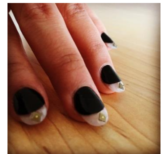
Beauty Tech Nails

この特別なネイルチップをつけ、日常的な動作をすることで、さまざまなデバイスやサウンドのコントロールが可能になる様子を体感していただけます。