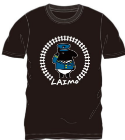
© Cherng Licensed by HIM Music