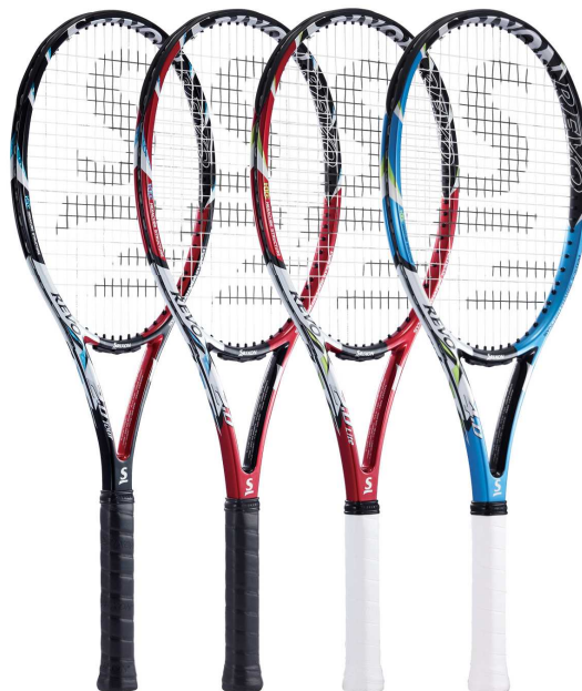
スリクソン レヴォ X 2.0 ツアー / 2.0(2.0+) / 2.0 ライト / 4.0

現代のテニスでは攻撃力は不可欠ですが、相手から攻められた時にいかに攻めきれないようにディフェンスをするべきかが大切です。新しい REVO シリーズは、劣勢な状態(オフセンターで取られる状態)でもラケットがリカバリーしてくれるので、安定感のあるボールでディフェンスができ、ときにはパワーのあるボールでカウンターショットを放つことができるため、形勢が逆転でき有利な展開に持っていけるラケットです。今回新たに、「REVO X2.0」の軽量版で操作性の良い「REVO X2.0LITE」をラインアップに追加しました。メーカー希望小売価格(消費税込み)は、「REVO X2.0TOUR」が34,650円<本体価格33,000円>、「REVO X 2.0/2.0プラス」、「REVO X2.0LITE」、「REVO X4.0」が33,600円<本体価格32,000円>です。