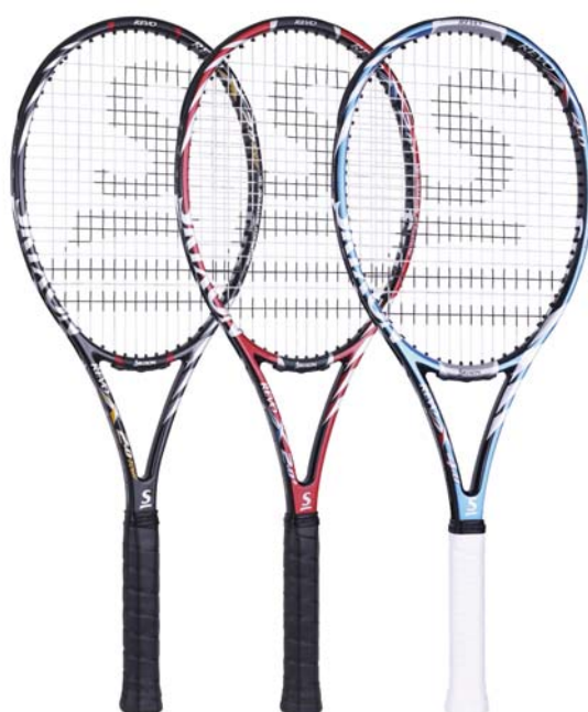
スリクソン レヴォ X 2.0ツアー / 2.0(2.0+) / 4.0 SRIXON

SRI スポーツ(株)(本社:神戸市、社長:野尻 恭)は、高い打点や低い打点でもスピンのかかったスピードボールが打てる競技系テニスラケット「スリクソン REVO(レヴォ) X」シリーズを(株)ダンロップスポーツ(本社:東京、社長:水野 隆生)を通じて、7月12日から全国一斉発売します。「REVO」とは「Revolution」の略で、「プレーヤーの技術に革新をもたらすラケット」を意味します。メーカー希望小売価格(消費税込み)は、「REVO X 2.0 Tour」が34,650円<本体価格33,000円>、「REVO X 2.0/2.0+」と「REVO X 4.0」が33,600円<本体価格32,000円>です。