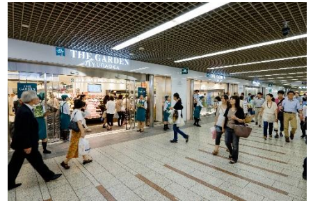
『ザ・ガーデン 自由が丘』