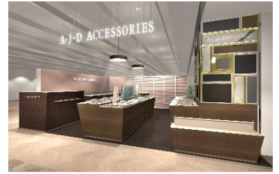
『アジデアアクセサリーズ』