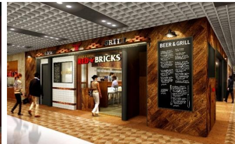
『レッドブリックス』