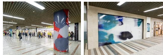
『市役所通り壁面・列柱』

スーパーラウンジアートの第一人者として、現代のアートシーンを賑わせている古門圭一郎氏が描いた市役所通りの壁面・列柱アートは、独自の世界観と豊かな色彩感覚が融合し、新生川崎アゼリアの誕生を見事に表現しております。