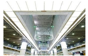
『リーフシャンデリア』

JR川崎駅からの導線、川崎アゼリアの玄関口ともいえる「サンライト広場」には、光の射し込む地下街という、アゼリアならではの長を活かした新たなモニュメント『リーフ シャンデリア』が心地よい空間を演出しております。