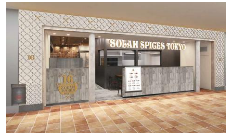
『SOLAH SPICES TOKYO』