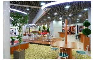
『ハミングガーデン』