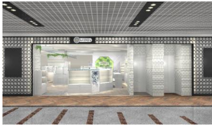
『コスメティクスシドニー』