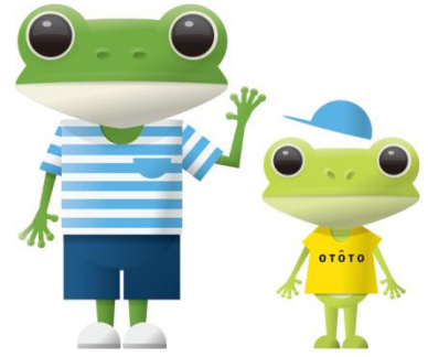
マスコットキャラクター「カワサキカワル」