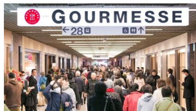
グランドオープンで賑わう様子 「GOURMESSE」