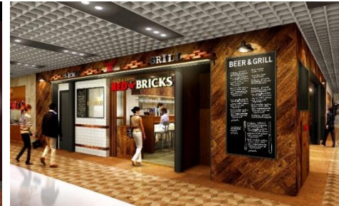
『レッドブリックス』