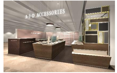
『アジュデアアクセサリーズ』