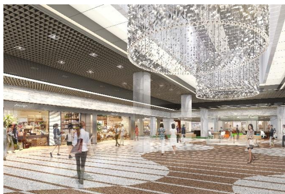
川崎アゼリア第2期リニューアルオープン区画 『GOURMESSE』、『LIFEGRAND』（イメージ）