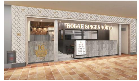
『SOLAH SPICES TOKYO』