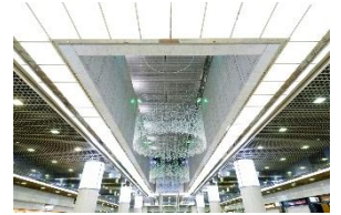
『リーフシャンデリア』

JR川崎駅からの導線、川崎アゼリアの玄関口ともいえる「サンライト広場」には、光の射し込む地下街という、アゼリアならではの長を活かした新たなモニュメント『リーフ シャンデリア』が心地よい空間を演出しております。