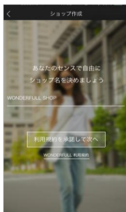
2. ショップ名を入力