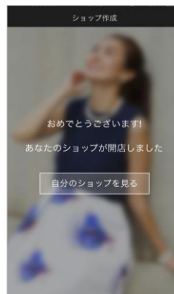
4. ショップ作成完了