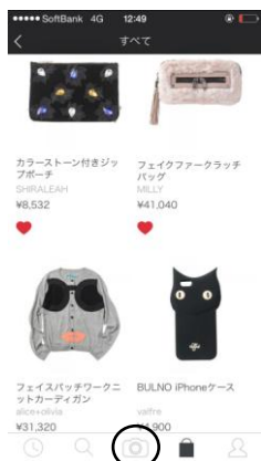
1. カメラボタンをタップ

誰でも簡単に出来るよう、①ショップ名②マージンを振り込む際に必要な口座情報の記入のみで開設することができます。