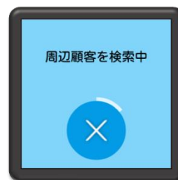
▲顧客情報を自動検索