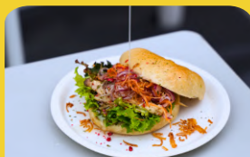
根菜のごま油ラー ベーグルサンド