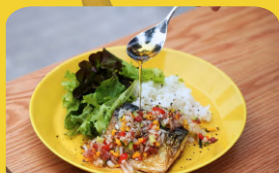
胡麻香る鯖焼き ザクザク野菜の梅肉ソース