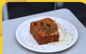
ごま油香る キャロットケーキ

ごま油部×SWITCH STANDコラボメニュー提供期間 赤羽/元住吉: 12/10(火)~14(土)、17(火)~21(土) 初台/お台場: 12/10(火)~13(金)、16(月)~20(金)