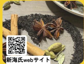
新海氏webサイト ※写真はイメージです