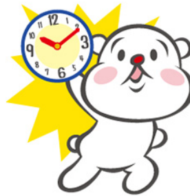
LINEスタンプ 時報クマ