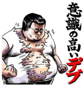
LINEスタンプ 意識の高いデブ

制作者である「グラスフィール」は、Twitter のフォロワー数 7 万人、最高順位 29 位の「意識の高いデブ」や、最高順位 25 位の LINE スタンプ「トークマン」。うんこが審査に通らずソフトクリームにして審査を通過した「くりみ」などの制作実績があります。