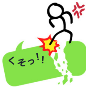
LINEスタンプ トークマン