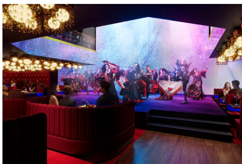
3階『座・グラン東京』

※お客様のご要望に応じてパーティーイベントや社内イベントなどでの貸切利用が可能です。