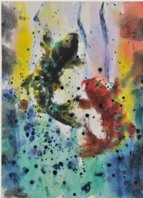
版画「昇鯉図」 (作品イメージサイズ: 53×38cm) 132,000円