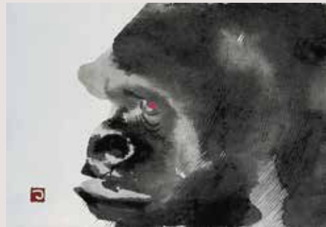
版画「ゴリラ」 (作品イメージサイズ: 27.5×36.5cm) 77,000円