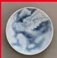
伊万里焼 「鶴太郎工房 辰干支皿」 6,600円