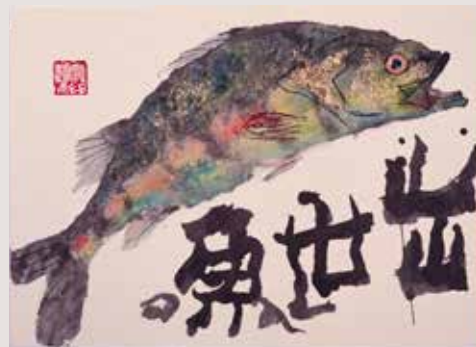
版画「出世魚」 (作品イメージサイズ: 43.3×55.3cm) 132,000円