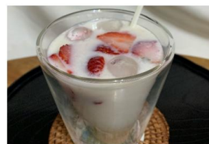
甘酒いちごミルクソーダ

※ 『晴れのち糀』公式ブランドサイト： https://www.hikarimiso.co.jp/harenochikojji/