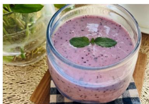
ブルーベリー甘酒スムージー