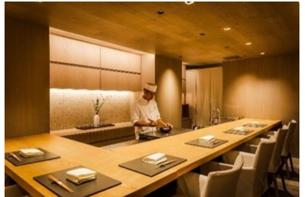
広々とお使いいただける個室もございます。

Facebook: https://www.facebook.com/ginzakuki/