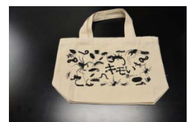
キモい展トートバッグ 600円

『キモい展』のメインビジュアルを使用した「キモい展マグカップ」や「キモい展缶バッジ」、気持ち悪い生き物たちのシルエットを散りばめた「キモい展トートバッグ」等を販売いたします。