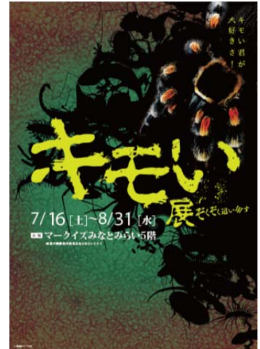
キモい展ポスター