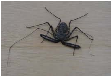
名称：タンザニアバンデッドウデムシ

クモとサソリとタガメを合体させた後に、踏み潰したような扁平で手足の長い節足動物です。体長 5mm～4cm 程度。世界 3 大奇蟲の一つとされ、日本には生息していません。