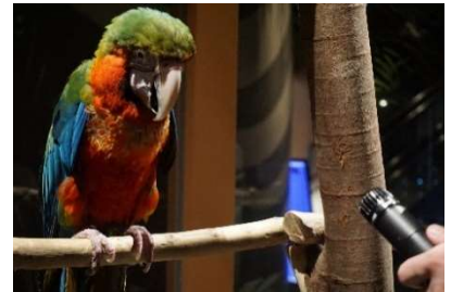
動物たちの鳴き声 録音の様子