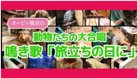
「鳴き歌動画」イメージ