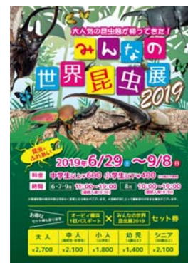
『みんなの世界昆虫展 2019』イメージ

開催期間 : 6月29日(土)～9月8日(日) 開催時間 : 11:00～19:00(最終入場 18:30) ※8月中は 10:00～19:00(最終入場 18:30) 場所 : マークイズみなとみらい 5F 特設会場(オービ横浜エントランス前) 料金 : 中学生以上 ¥600、4歳～小学生 ¥400、3歳以下無料 ※オービ横浜入館料はかかりません。