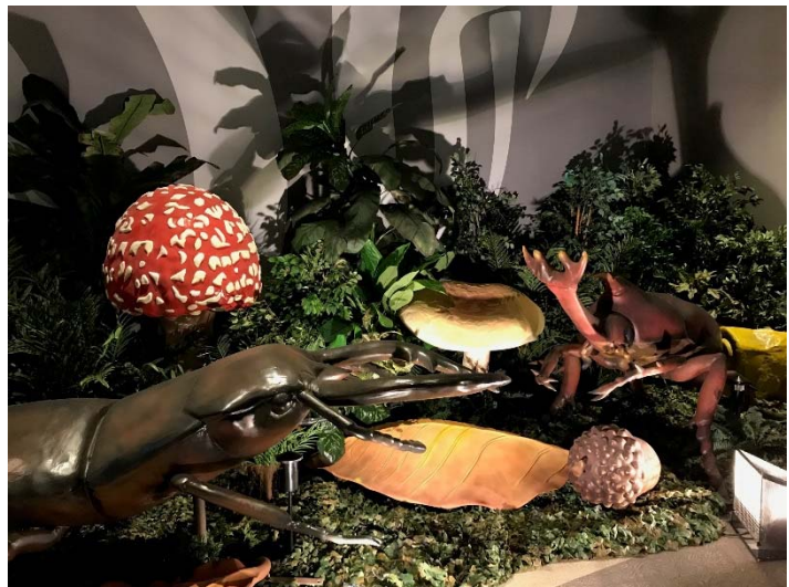
昨年の『変身！昆虫スゴわざ展 2018』開催の様子

昨年大好評頂いた「変身！昆虫スゴわざ展」が新たな装いで本年も開催されます。本イベントは、「昆虫の世界」をテーマに、昆虫の「スゴわざ」を全身で体感できる、体験型コンテンツが満載のイベントです。普段見ることができない昆虫のドアップ画像と一緒に写真を撮ることができる“昆虫キメ顔コンテスト！”では、自分が昆虫の世界に迷い込んだかのようなワクワク感を感じることができます。また、なりきりアイテムでカブトムシになりきって全長180cmのヘラクレスオオカブトと綱引きで力比べをすることができる“オーエス！ヘラクレス！”やセミのなりきりアイテムを着用し木にどれだけ掴まれるかチャレンジする“ミンミンタイムアタック！”など、自分が昆虫になった気分で体験できるコンテンツも用意しています。