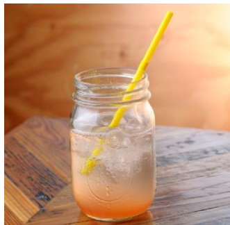
「自家製いちご酵素ソーダ」 価格:500(税込) 店舗名:IKAYAKI STAND

春限定メニューとして、オリジナルのいちご酵素を使用した「自家製いちごの酵素ソーダ」、あっさり塩味で炒め、菜の花・芽キャベツを添えた「鶏肉とイカの炒め春野菜合わせ」、お客様からのリクエスト数NO1、タコの代わりに海老を1尾とマヨネーズが入れた「エビマヨ焼き」などが登場します。