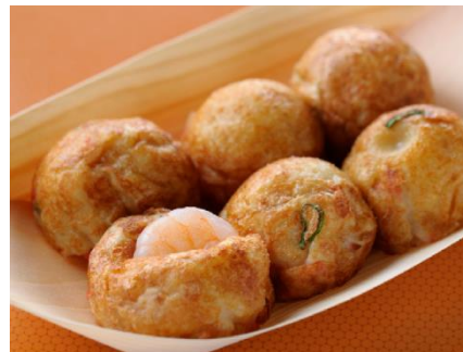
「エビマヨ焼き」 価格:6個600円(税込) 店舗名:芋蛸