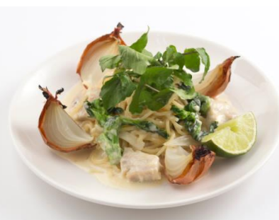
「チキンと菜の花のアルフレッドソースパスタ」 価格: 1,320円(税込) 期間: 3月11日(金)～4月21日(木)