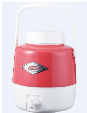
「コールマン スチールベルトジャグ」 価格:9,180円(税込) 店舗名:WILD-1

お花見やバーベキューに活躍しそうなお花見も可愛い給水容器「コールマン スチールベルトジャグ」、ベビーカーの老舗ブランドとのコラボレーションで、軽量コンパクトでも快適な走り心地を実現したペット専用カート「Combi × DOGDEPT コラボカート」、春らしい花柄があしらわれたメイドインジャパンの高機能ポーチ「Barbie ポーチ(全3種)」などが登場します。