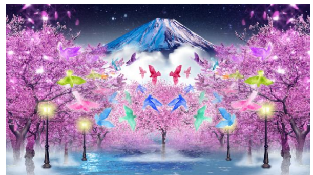
左側壁面イメージ: 夜桜と富士山