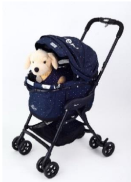
「Combi × DOGDEPT コラボカート」 価格:58,320円(税込) 店舗名:DOG DEPT+CAFE