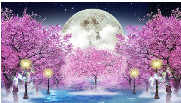
左側壁面イメージ: 夜桜と月光