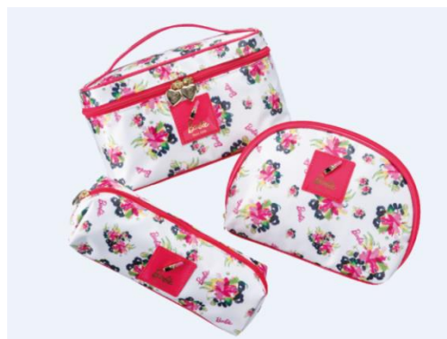
「Barbie ポーチ各種」 (左上)価格:4,320円(税込) (左下)価格:2,376円(税込) (右)価格:3,024円(税込) 店舗名:イマーベラス