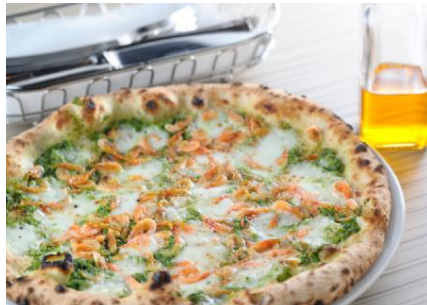
「桜海老と菜の花のジェノベーゼ」 価格:1,814円(税込) 期間:3月1日(火)~4月21日(木)