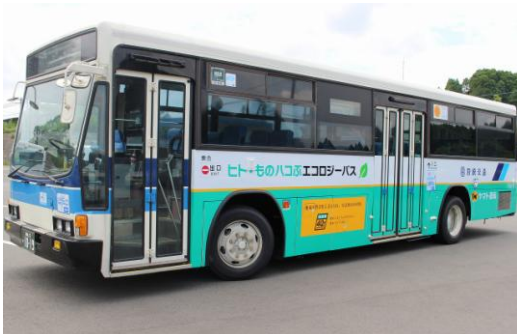
客貨混載を実施しているバス (宮崎交通・宮崎県)

岩手県でスタートした「客貨混載」の取り組みは、宮崎県そして、平成28年には北海道や熊本県でも地域のバス事業者と連携して展開しています。「プロジェクトG」を推進し、「客貨混載」に限らず、今後もさらに各地域における課題解決と地域活性化に貢献してまいります。