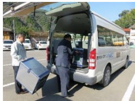
小川へ運ぶ荷物を積載