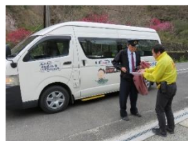
郵袋を村営バスに積載