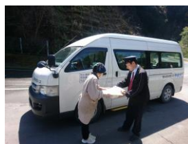
村営バスにヤマト運輸 の荷物を積載