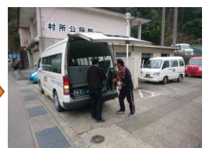
郵便局員が郵袋を受取り、 輸送完了