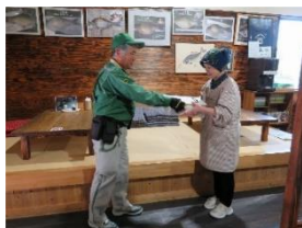
ヤマト運輸の荷物を 受取り、一時保管