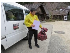
地区の郵便ポストから収集 した郵便物を郵袋に収納