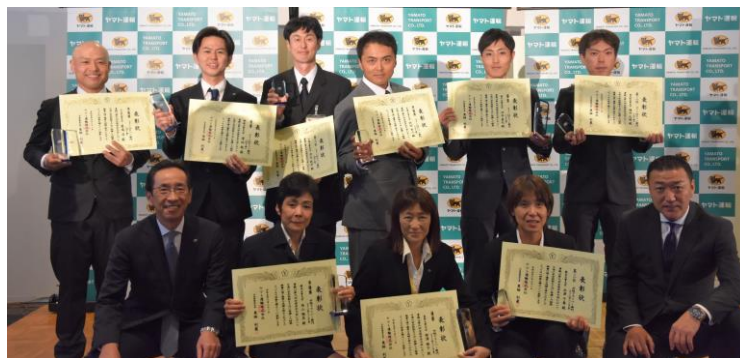
個人表彰受賞者のみなさん