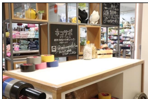
出品・梱包エリア