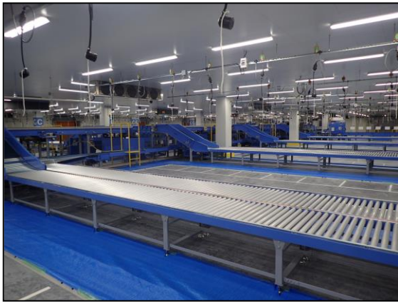
クール仕分け機器