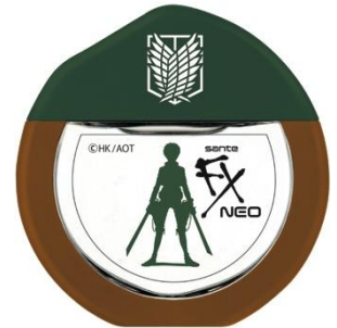
『サンテFXネオ エレンモデル』 (上)パッケージ (下)ボトル