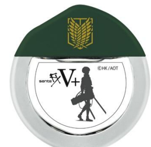
『サンテFXVプラス リヴァイモデル』 (上)パッケージ (下)ボトル