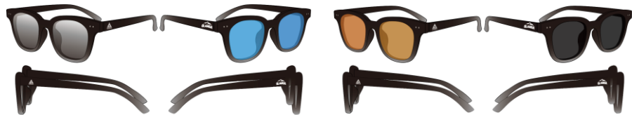
（左）ライトスモーク・ブルー・ブラウン・スモーク（右）