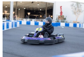
【シティサーキット東京ベイ】 屋外・屋内 EV カート 500 円引き