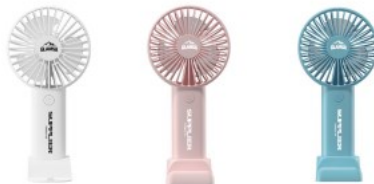
【GLAMSA PARK】 オリジナルハンディファン