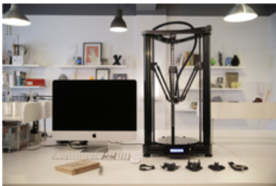
3D プリンター「Maestro」 （インタービジネスブリッジ合同会社）