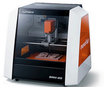
デスクトップ型切削加工機「SRM-20」 （ローランド ディー.ジー.株式会社）