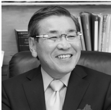
牧野 百男 鯖江市 市長