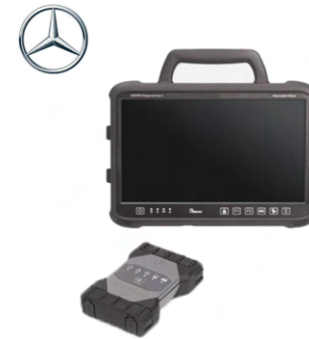
メルセデス・ベンツ専用 XENTRY