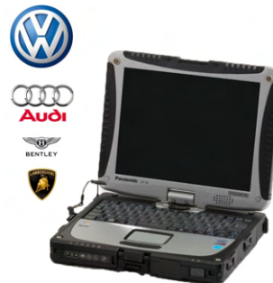
VW AUDI他専用 ODIS