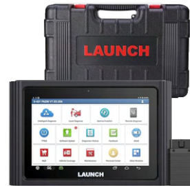
汎用診断機 LAUNCH PAD