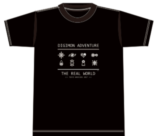
Tシャツ (全2種) ※各M・Lサイズあり ¥ 2,980(税別)