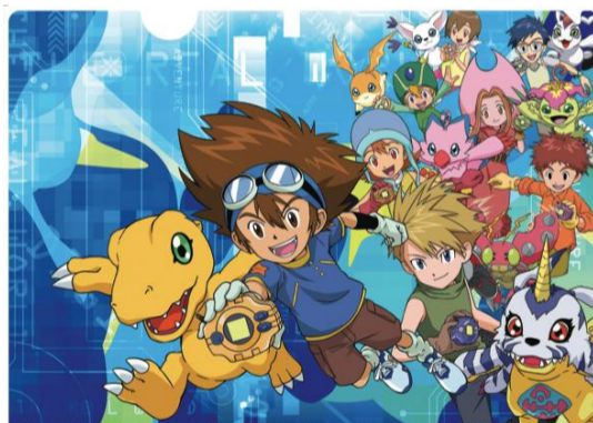
クリアファイル ¥ 350(税別)