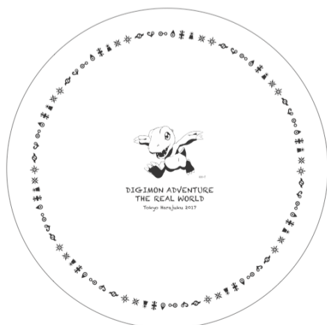
記念プレート ¥ 2,000(税別)