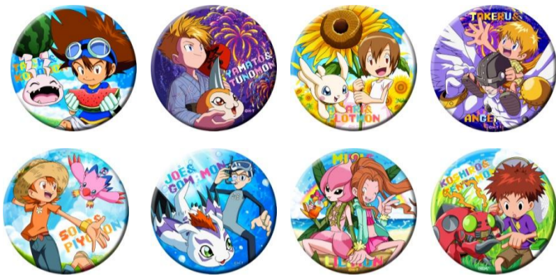
どデカ缶バッジ (全8種) ¥ 500(税別) ※ ブラインド

会場では、企画展限定の描き起こしイラストによるオリジナルグッズを多数販売いたします。 その他、個数制限のある商品もございますので、商品情報は企画展公式サイトにてご確認ください。