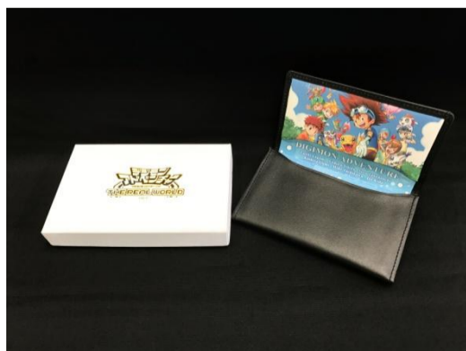
名刺ケース ¥ 10,000(税別)