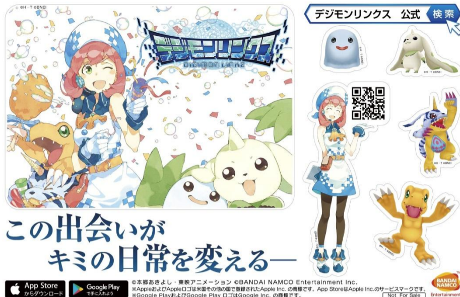
「デジモンリンクス」特製ステッカー