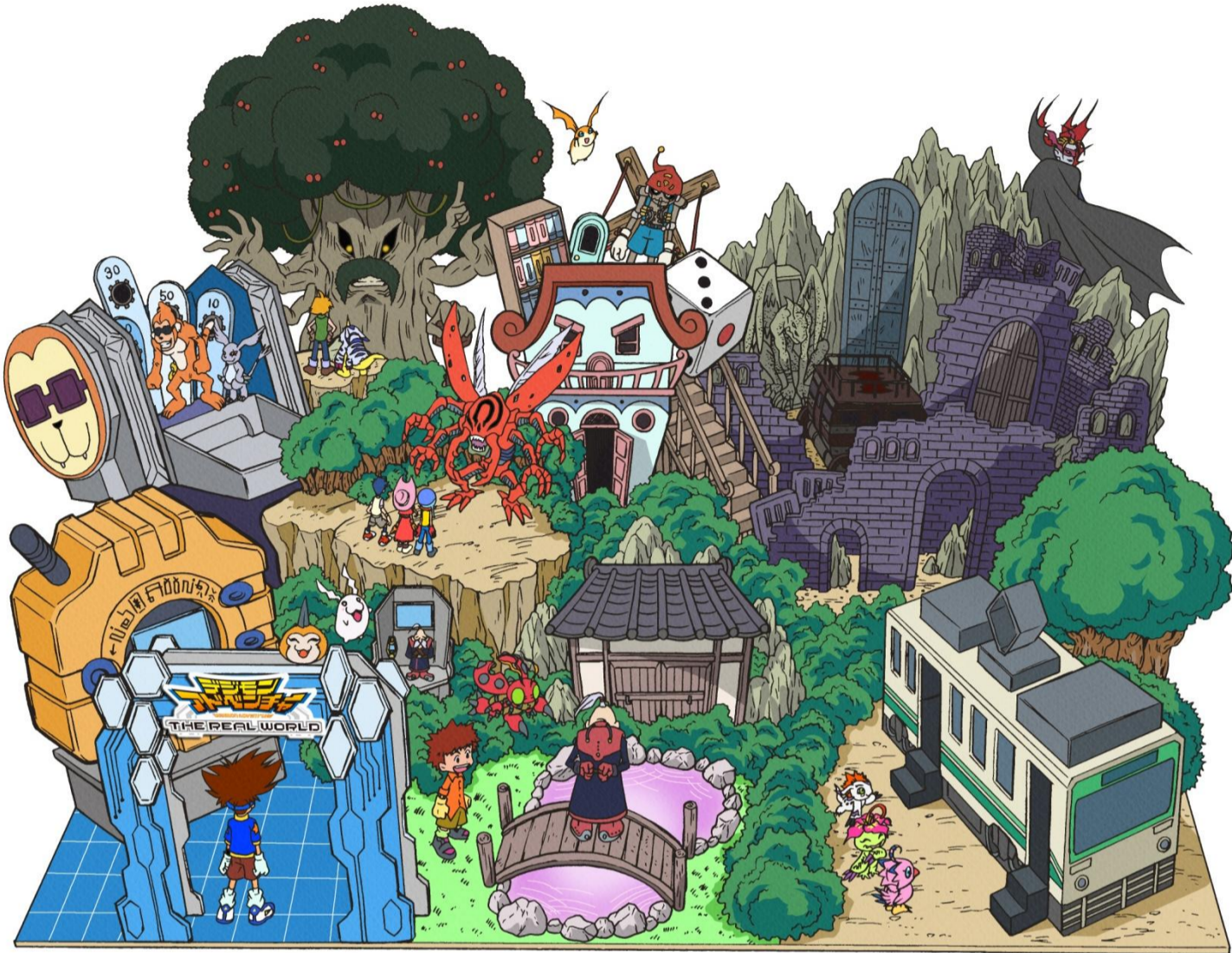
会場イメージマップ

デジヴァイスや、最終話の電車など名場面をオマージュしたコーナーを多数準備しています。