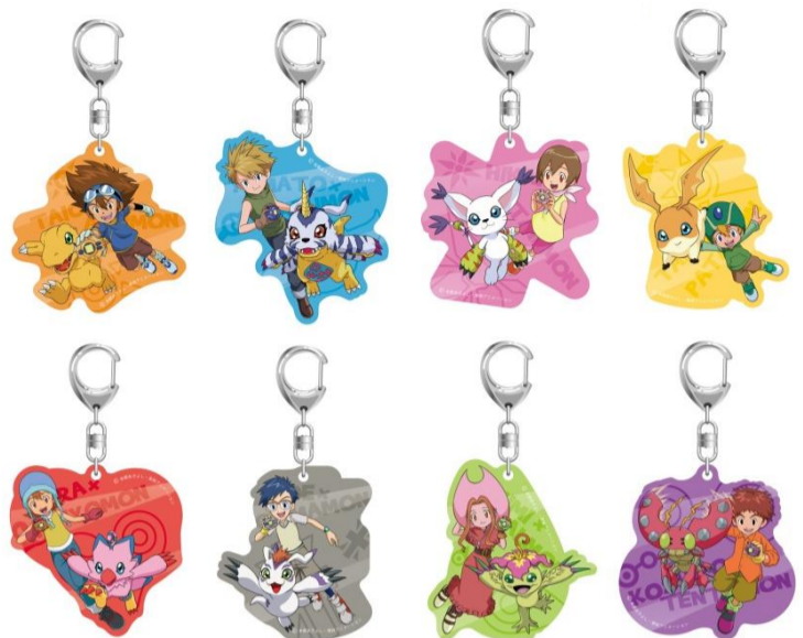
アクリルキーホルダー (全8種) ¥ 800(税別)