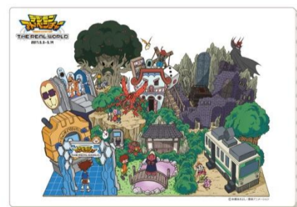
キャンバスアート ¥ 3,000(税別)