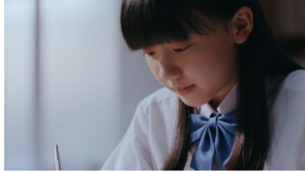
—小声でつぶやきながら 勉強