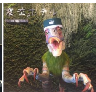
タブレットで宿泊受付、訪日外国人は パスポート読取りでチェックイン

アルメックスの特長である「汎用度の高い設計・カスタマイズ性」を活かし、受付ロボットやホテルシステムと連携・接続し、チェックイン受付から支払い、ルームキーの排出までをフロントスタッフを介さず行えるシステムソリューションが実現するとともに、ホテルスタッフの業務省力化、インバウンド観光客への対応、宿泊台帳管理の簡略化などにも寄与いたします。