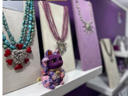
日本の伝統工芸品 「木目込の招き猫」のプレゼント