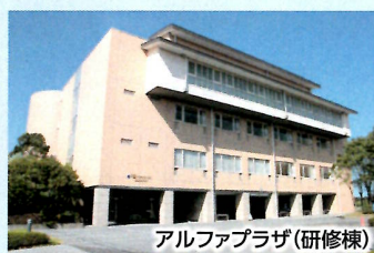
アルファプラザ(研修棟)