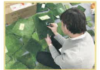
数十社のサンプルを研究している様子