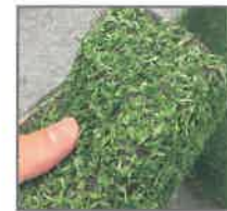
同じ人工芝でも、 どう見てもプラスチックなデザイン...

そしてゆくゆくは日本国内ではなく、世界の色々な国で、お手入れやメンテナンスに悩んでいる方々のお役に立ちたいと思っています。 そのために私達はこれからも進み続けたいと思います。