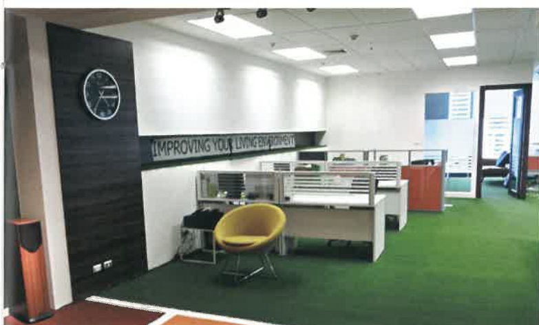
室内オフィスの人工芝施工イメージです。オフィスにグリーンが入るとスタッフのリラックス効果やストレス軽減が期待されるので、最新のオフィスに大人気です。