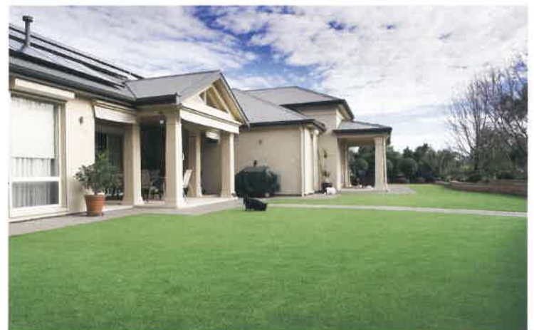
個人宅お庭の人工芝の施工イメージです。お庭でワンちゃんも走り回れるので充実したエクステリアライフが送れます。