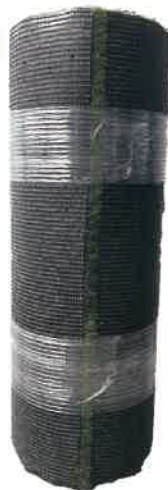
ロール状でお届け