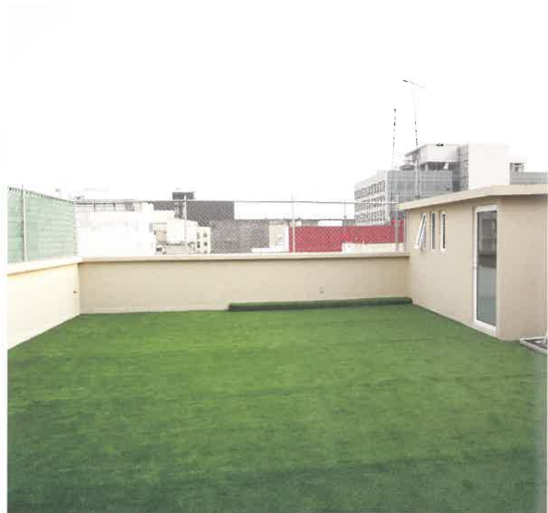
屋上に使用した人工芝の施工イメージです。人工芝は土もいらないので、屋上緑化に最適です。