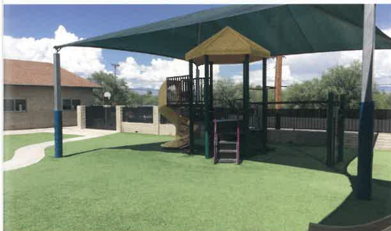
子供用の遊具の周りの人工芝の施工イメージです。不特定多数の人や子供たちが走り回る場所は、天然芝だと枯れてしまうので不向きでした。人工芝なら枯れる心配もないので最適です。