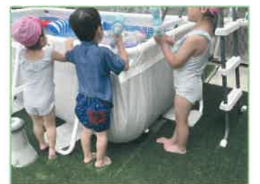
フワフワの肌ざわりは子供たちも大満足♪