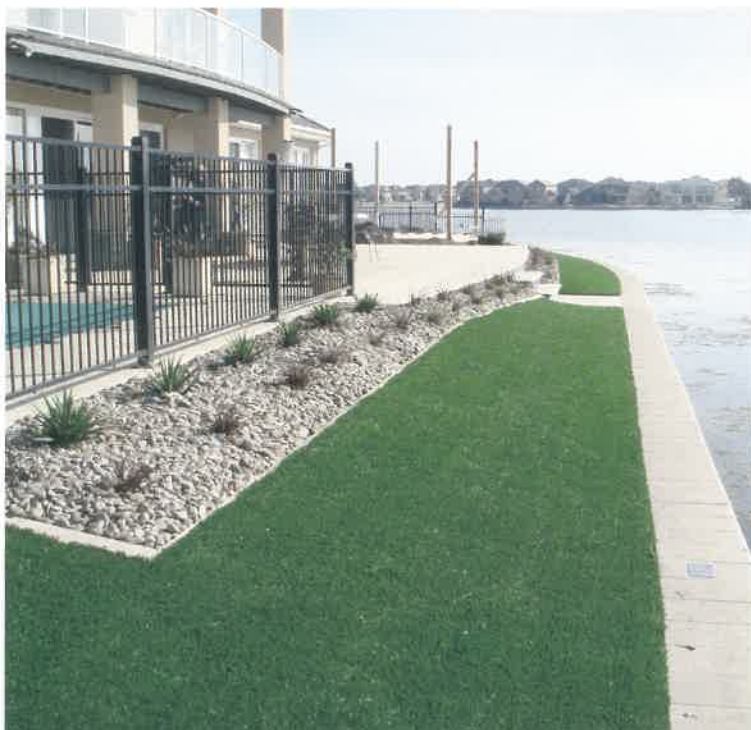
高級リゾートホテルの施工イメージです。人工芝なら一年中緑あふれる空間に仕上がります。