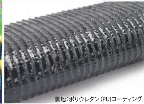
裏地: ポリウレタン(PU)コーティング

まるで天然芝のような綺麗な仕上がり! ふわふわな手触りで、お庭やベランダなど雨ざらしのエクステリアに最適! 土がない箇所にも施工できます。背面にはポリウレタン(PU)コーティングをしているので、芝が抜けにくく、通常のラテックス(ゴム)性のものより高耐久な仕様になっています。