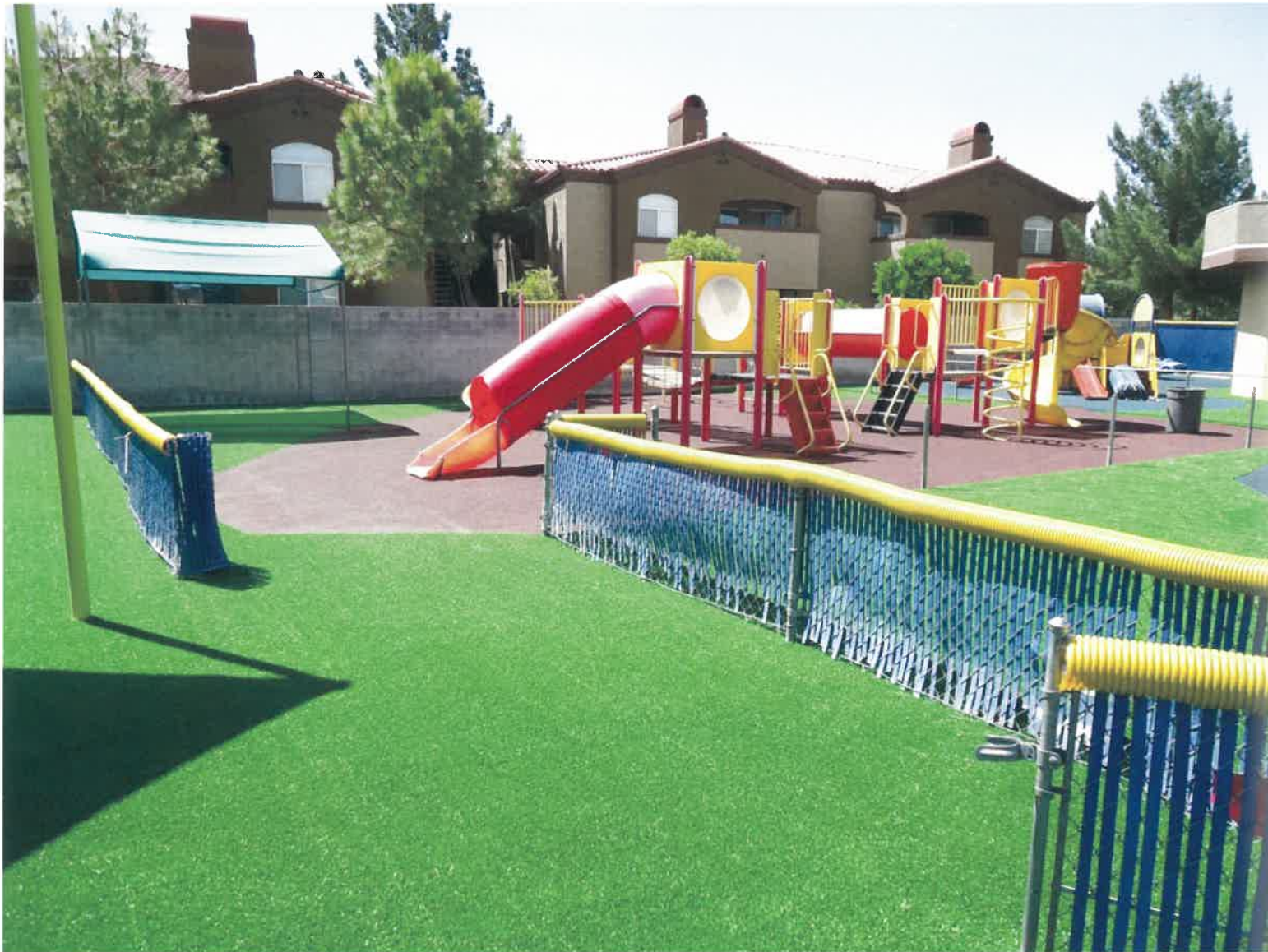
保育園の人工芝の施工イメージです。子供たちが笑顔で走り回る姿がイメージできます。ふわふわな人工芝はクッション性があるので転んでも安心です。