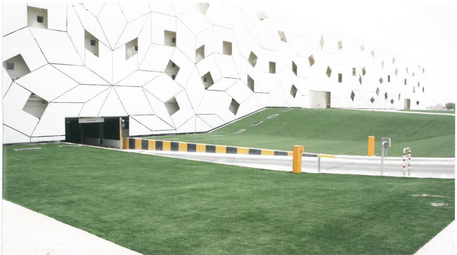
商業施設の人工芝施工イメージです。オシャレな商業施設のエクステリアには緑が大切です。芝の広場でお客様がくつろぐ姿が想像できますね。