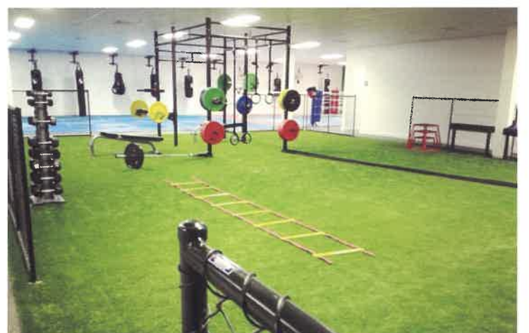
フィットネスジムの施工イメージです。グリーンを活用してゆったりとした雰囲気になり、他のジムとの差別化が図れます。