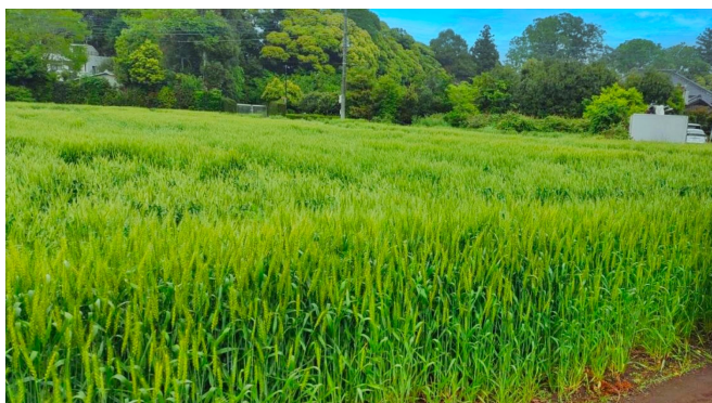
- 市内の麦畑の様子

現在株式会社 ぷらすわんで運営するRusty Nest Breweryでは、主にIPAを中心とした商品を販売しておりますが、今回の試験醸造を試行する中で、大網白里市産の麦とホップに最適なビールスタイルを模索し、その過程で誕生したクラフトビールを限定商品として販売予定です。開発途上で発生するフードロスの削減に寄与し、地域の消費者様のご意見を通じて地域とともに造り上げるビール造りを進めてまいります。