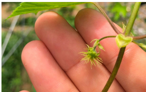
- 市内初となる大網白里産のホップも少しずつ成長しています