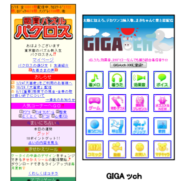
懸賞パズルパクロス