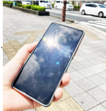
直射日光を浴びたり、暑い車内・室内に長時間放置することでデジタル機器の動作に不具合が起きる可能性も

今回の調査では夏にトラブルが起きた状況として「車のダッシュボードにデジタル機器を長時間放置してしまった」という回答が複数見られました。普段の習慣が、予期せぬトラブルを招いたことがわかりました。炎天下での外出やレジャーではデジタル機器の扱いにも注意が必要です。