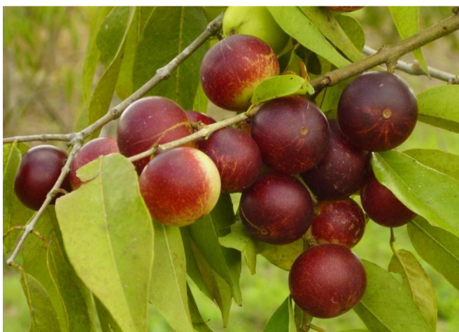
木になるカムカムの果実

最近話題のスーパーフルーツ「カムカム」。名前を聞いたことはあっても、詳しくは知らないという方も多いのではないのでしょうか。スーパーフルーツ「カムカム」の魅力を、カムカムの妖精「カムシー」がナビゲートします。また、カムカムに含まれる成分について専門家がコメントする豆知識コンテンツもあり、カムカムやその成分について楽しく学べるサイトです。