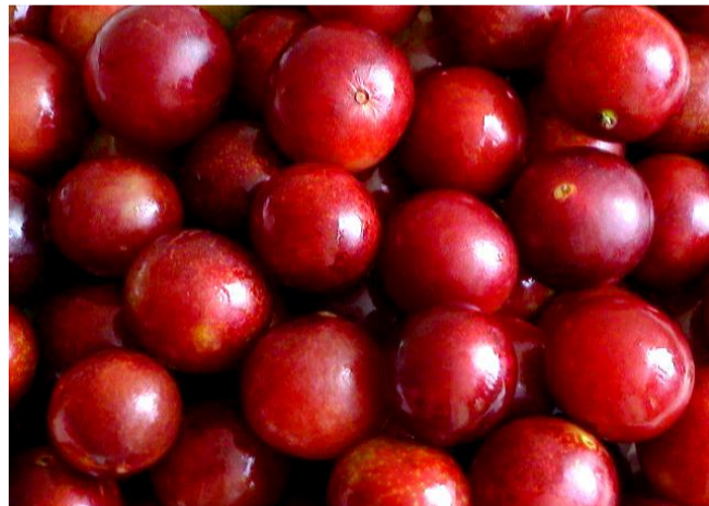
熟したカムカムの果実