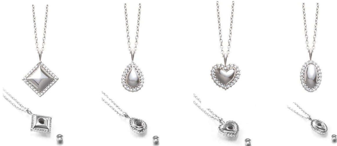
エタニティ ダイヤ

【素材】：シルバー925（キュービックジルコニア）、 K18（イエローゴールド、ローズゴールド、ホワイトゴールド）、 プラチナ900（K18、プラチナともにダイヤモンド付き）