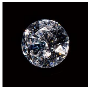
ラウンドデイジー